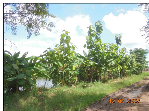
รูปที่ 1-3 พื้นที่สีเขียวโดยรอบโครงการ