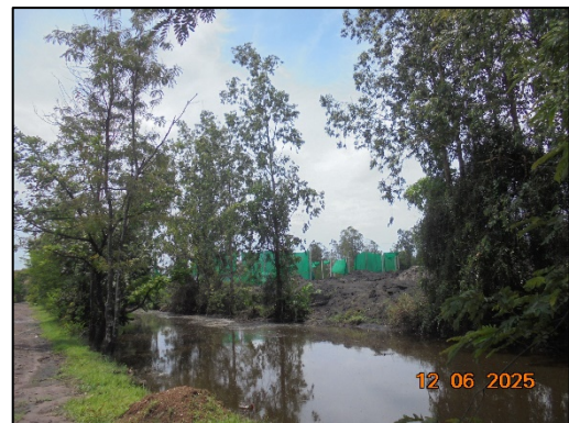
รูปที่ 1-3 (ต่อ) พื้นที่สีเขียวโดยรอบโครงการ