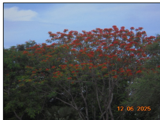
รูปที่ 1-3 (ต่อ) พื้นที่สีเขียวโดยรอบโครงการ